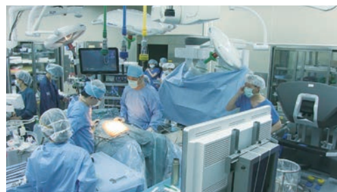
図1 | ロボット手術 ポート設置時の手術室の様子

モニター、器械台と手術室内が狭くなる要因はいくつもあります。なかでも広い面積を占有するのが無影灯。無影灯の柱自体が