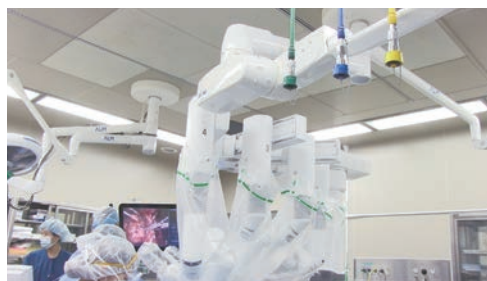
図2 | ペイシェントカートと天吊り式の无影灯